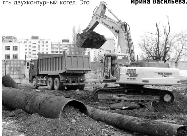
Работы на строительстве дома идут полным ходом.

удобно – вы сможете включать обогрев квартиры, когда захотите. Но самое главное, что это экономически выгодно: не надо платить за едва теплые батареи, отсутствие горячей воды. Жители нашего дома смогут сами контролировать эти расходы и получать именно то, за что они платят.® Ирина Васильева.